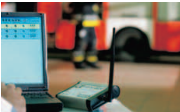
alphaBASE mit einem Standard-PC