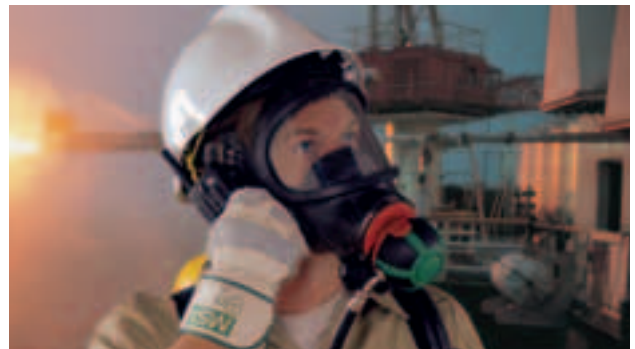
3S-PS-MaXX mit AutoMaXX-AS