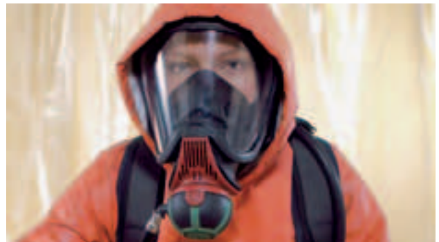
Ultra Elite-PS-MaXX mit AutoMaXX-AS