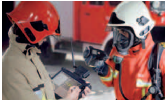
xplore TABLET PC mit alphaBASE Akku