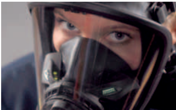
alphaHUD in Ultra Elite

alphaSCOUT empfängt die Druckluftdaten von einem Sender [ alphaMITTER ], der auf der Pressluftatmer-Trageplatte montiert ist, und berechnet die verbleibende Einsatzzeit. alphaSCOUT kann bezüglich Geräteträger, Trupp- oder Wachzugehörigkeit mit Hilfe des alphaTAGs einfach personalisiert werden. Über den alphaTAG können auch Sonderfunktionen aktiviert werden, z. B. Repeater-, Alarmgeber-, Begleiter- und Tiefschlaf-Modus.