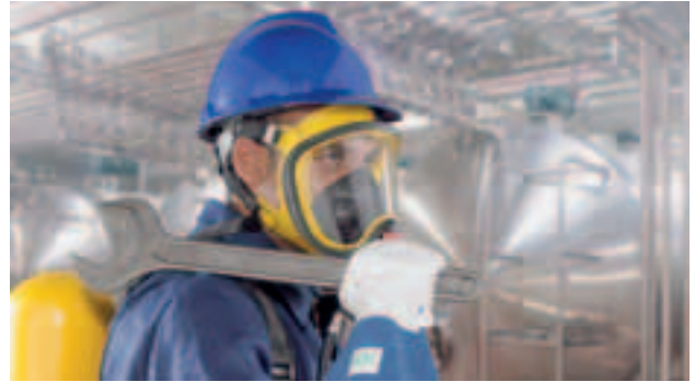
Ultra Elite-PS-MaXX-Silikon mit AutoMaXX-AS

Die Ultra Elite Vollmaske wurde mit Blick auf die Zukunft entwickelt. Durch ergonomisches Design, modernste Technologie und sorgfältige Details ist sie die perfekte Ergänzung zur neuen alpha -Serie. Mehr als 40 Versionen stehen zur Auswahl, um alle Anwendungen abzudecken. Dabei werden zwei Größen und zwei Maskenkörper [Silikon und Gummi] angeboten. Verschiedene Ausführungen der Bänderung: Gummi, Silikon und Nomex [EZ: easy-don] stehen zur Verfügung. Die Polycarbonat-Sichtscheibe ist mit Silikat beschichtet. Die ergonomische Ultra Elite hebt sich durch ihr verzerrungsfreies Blickfeld, den beispielhaften Tragekomfort und die exzellente Sprachübertragung ab. Für weitere Informationen steht Ihnen unser Prospekt ID 05-418.2 zur Verfügung.