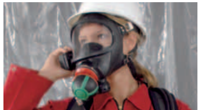
3S-PS-MaXX mit AutoMaXX-AS

Mit über 5 Millionen verkauften Stück ist die 3S weltweit die erfolgreichste Vollmaske. Der hohe Komfort und die enorme Zuverlässigkeit machen die 3S zu einem Partner, auf den Sie sich verlassen können. Die 3S steht in über 50 Versionen für praktisch alle Anwendungen zur Verfügung. Für detaillierte Informationen fragen Sie bitte nach unserem Prospekt ID 05-405.2.